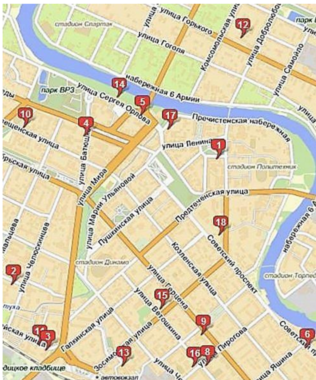
18 госпиталей и эвакуогоспиталей располагались в Вологде в разное время военных лет.

Эвакуогоспитали располагали неплохой материальной базой. Они имели: рентгеновские, физиотерапевтические и зубоорудовые кабинеты, клиничко-диагностические лаборатории. Однако врачей-специалистов не хватало. Так, например, в эвакуогоспитале №1538 работали два хирурга, один из которых являлся заведующим отделением, другие хирургические отделения возглавляли два гинеколога и отоларинголог. Одной из причин, осложняющих лечение раненных, являлась острая нехватка лекар-