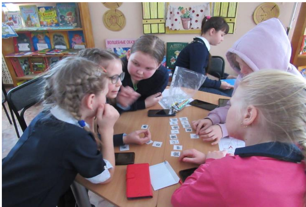
Детский отдел Тотемской центральной районной библиотеки им. Н. Рубцова МБУК «Тотемская централизованная библиотечная система»

Коллеги уверены, что знания, полученные во время игры, в дальнейшем помогут ребятам избежать неприятностей при работе в Интернете.