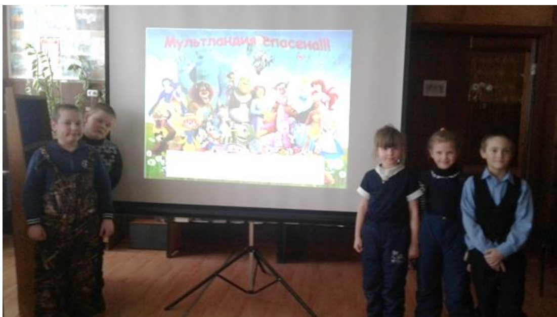
Погореловский филиал МБУК «Тотемская централизованная библиотечная система»