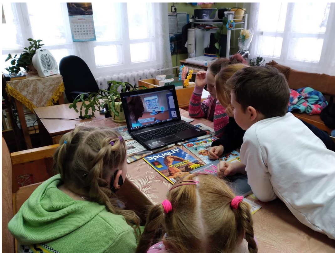
Великодворский филиал МБУК «Тотемская централизованная библиотечная система»