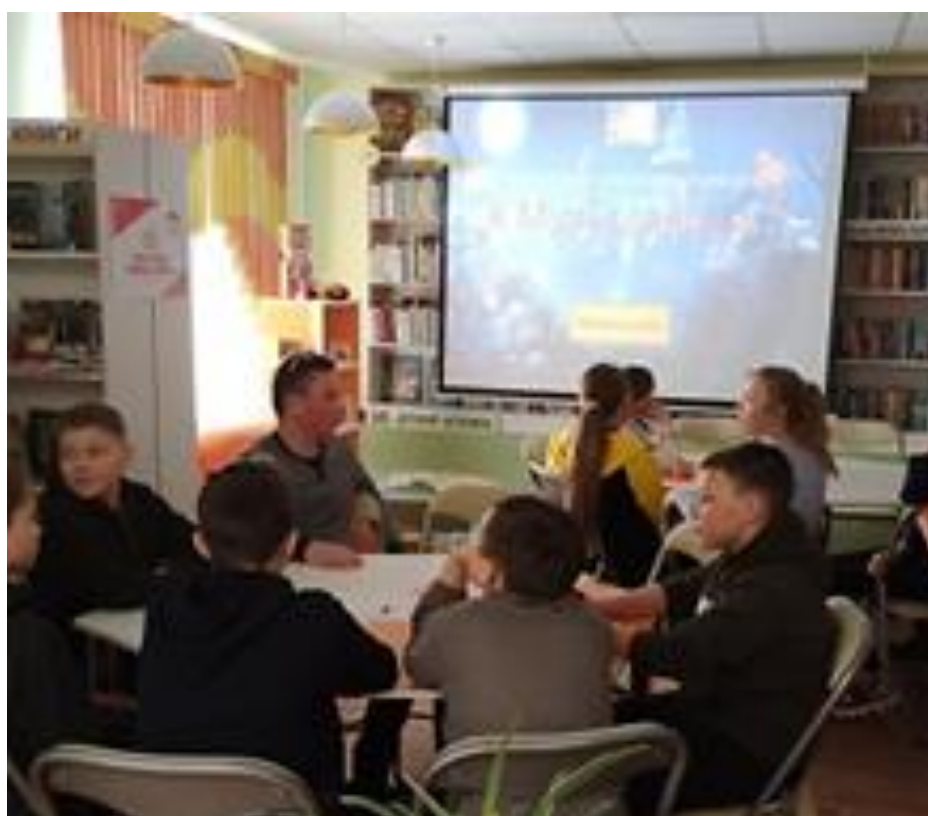
Пятовский филиал МБУК «Тотемская централизованная библиотечная система»