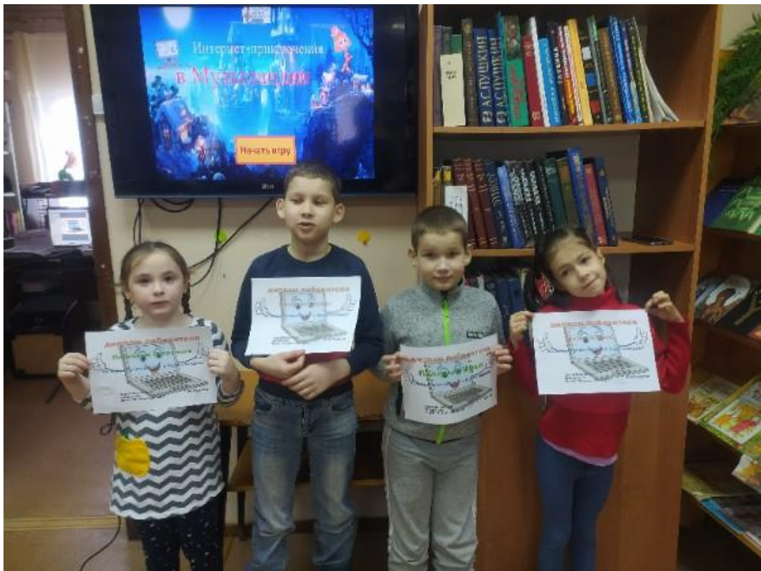
Юбилейный филиал МБУК «Тотемская централизованная библиотечная система»