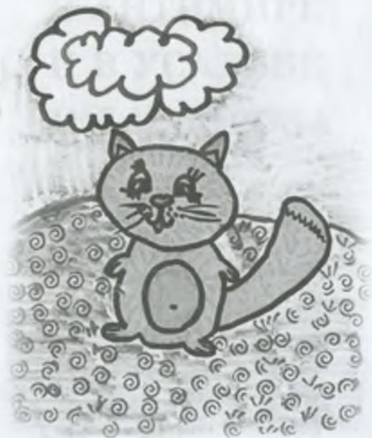
Рис. Д. Колесниковой