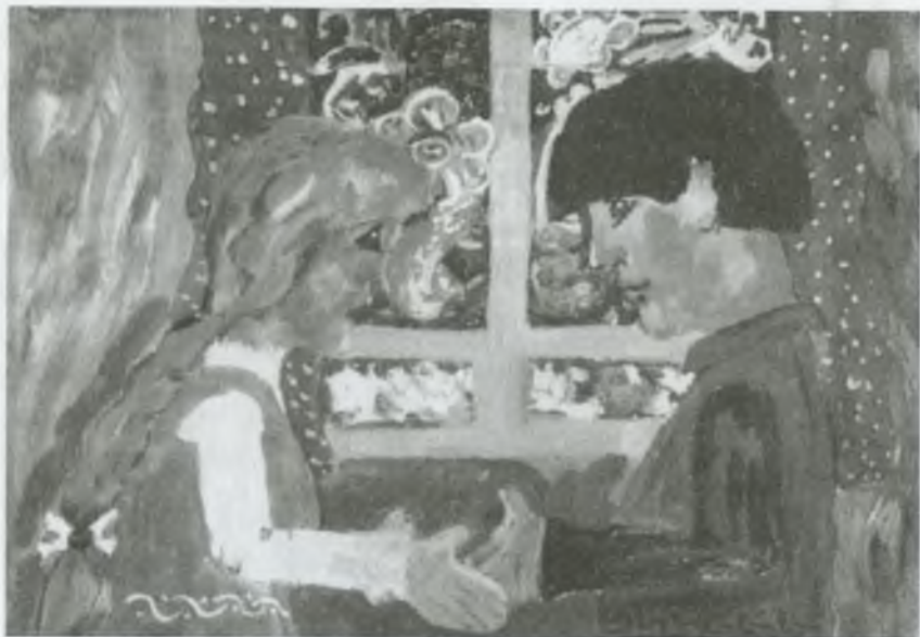
Подарок Морозки. Рис. Н. Нечаевой

Вернулись они в деревню. Старуха как всё услышала, как увидела подарки от Морозки Марфуше, вся завистью зашлась. Наскоро оделась и в лес к Морозке, подарки просить. С тех пор её больше никто нигде не видел. И что с ней стало, никто не знает.