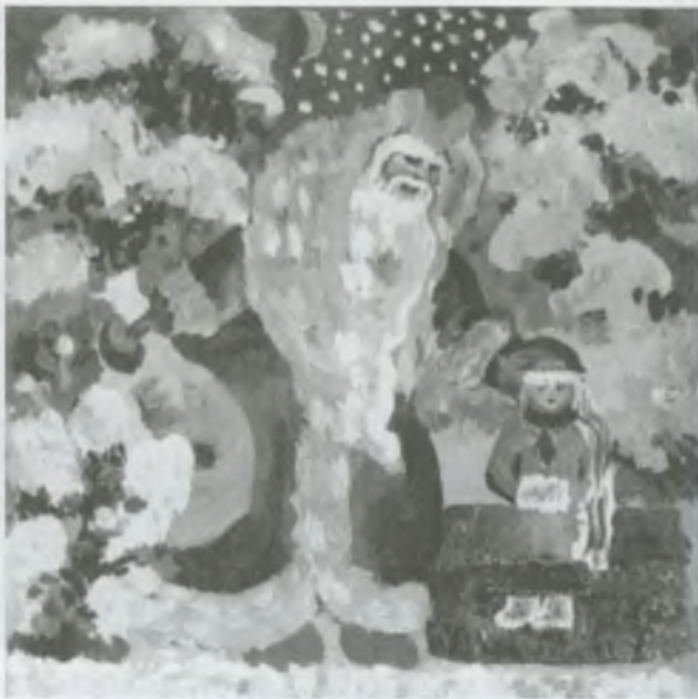
Подарок Морозки. Рис. К. Чупровой