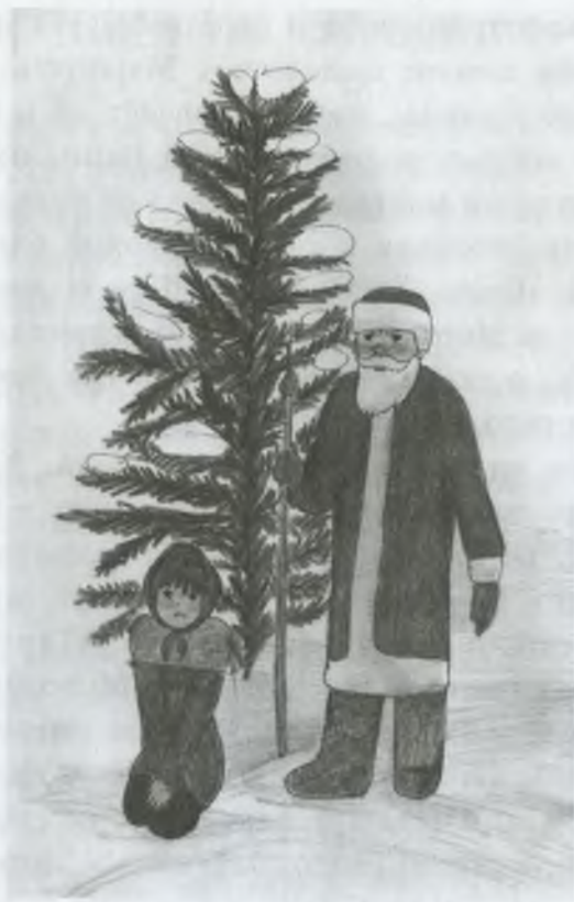
Подарок Морозки. Рис. К. Калининой

деревянных птиц, резьбой украшенные, солонки наподобие зверей и многое другое, им самим сделанное. Просил мастера взять его в ученики. Чирков был знаменитый мастер золотых, серебряных и железных дел. И Ванюша очень хотел такому дивному искусству научиться. Слава о великоустюгских мастерах по всей стране шла и даже за границу попала. Вот какое мастерство хотел Ваня постичь.