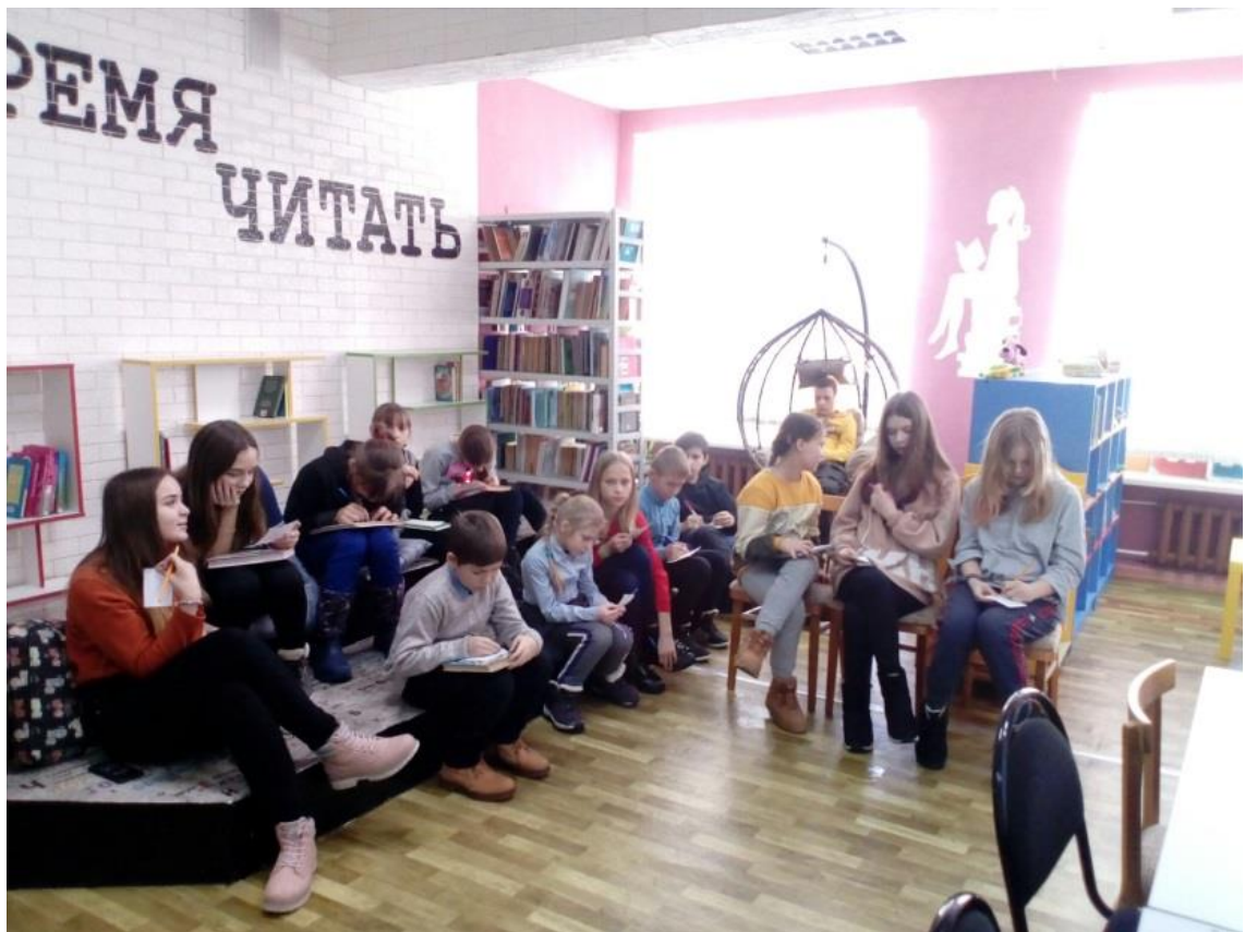
Семигородний филиал №12 МБУК «Харовская ЦБС им. В.И. Белова»