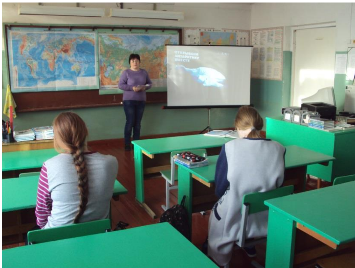
Шатинский филиал № 17 МБУК «Харовская ЦБС им. В.И. Белова»