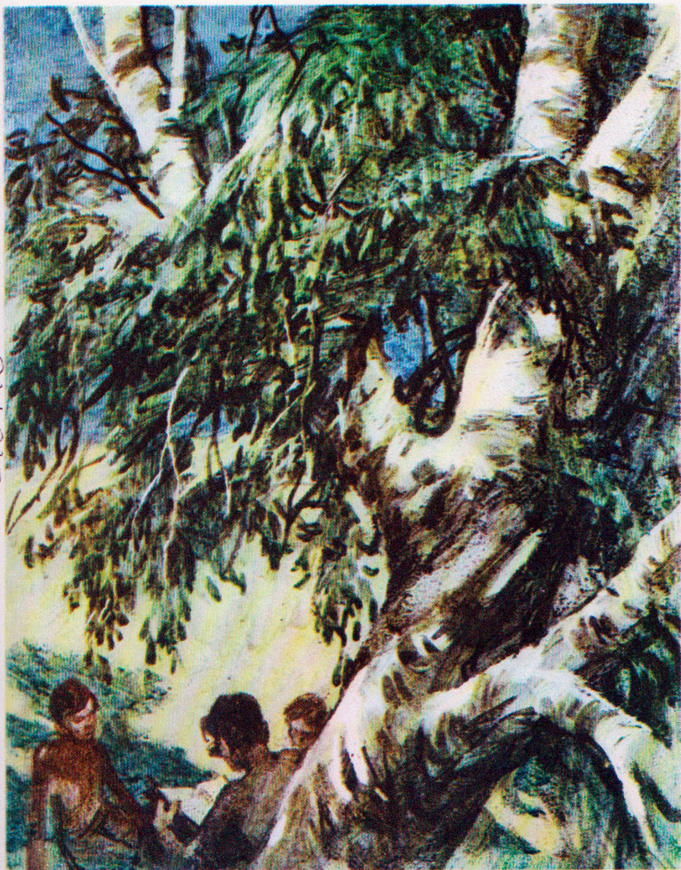
Вологодская областная детская библиотека