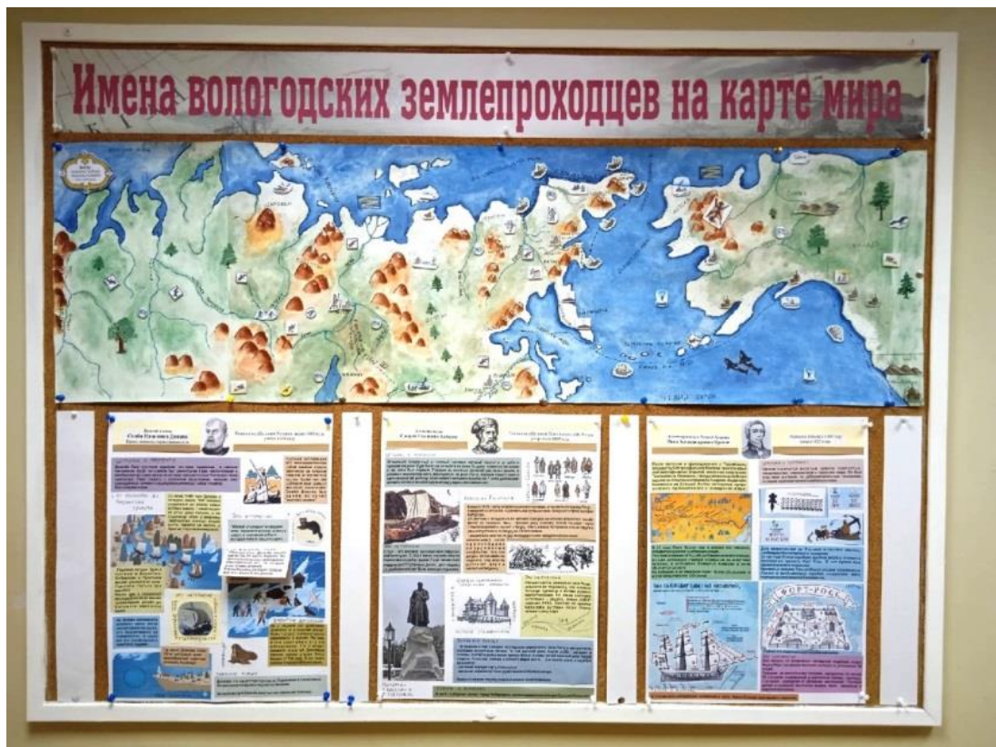
БУК ВО «ВОДЬ»