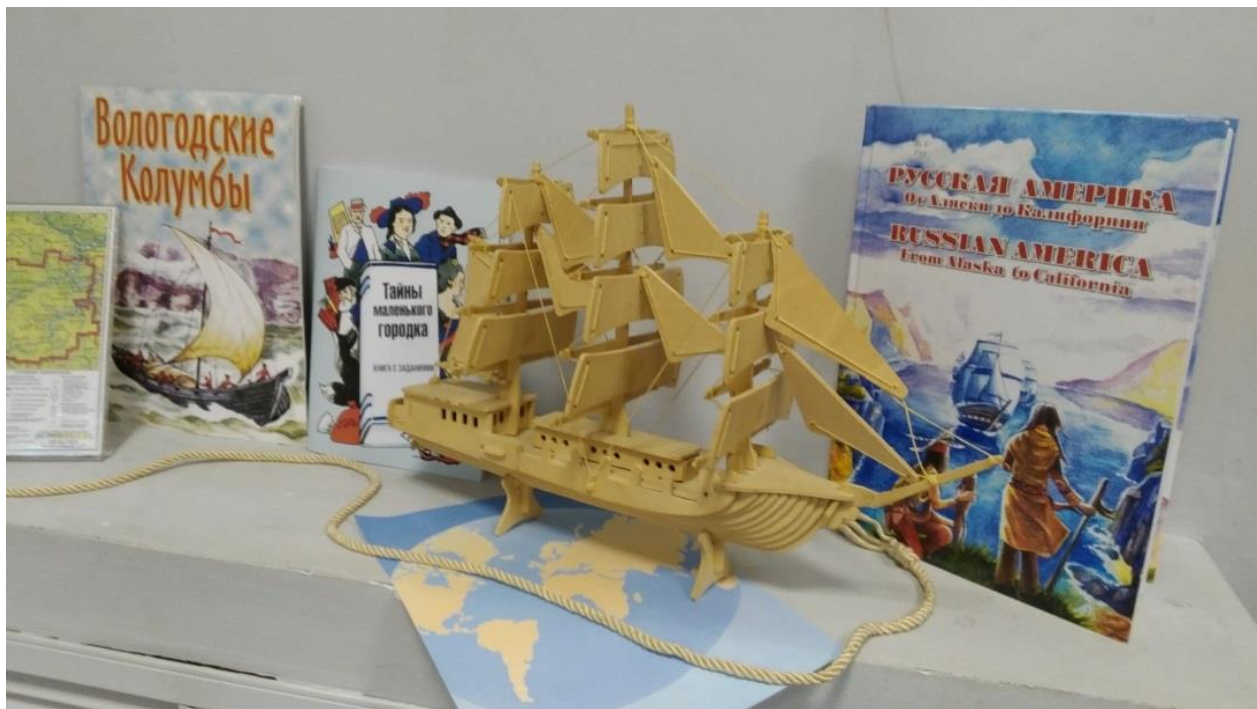
Детская библиотека №12 г. МБУК «ЦБС г. Вологды»