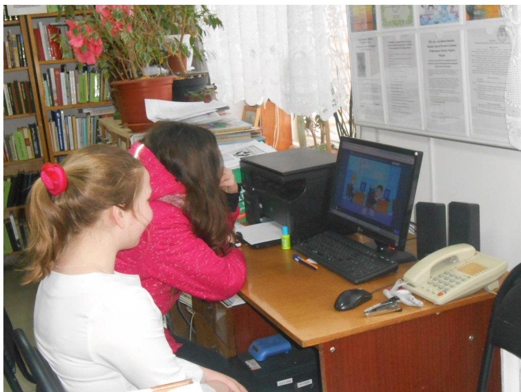
Подлесный библиотечный филиал № 12 МБУК «Межпоселенческая централизованная библиотечная система Вологодского муниципального района»