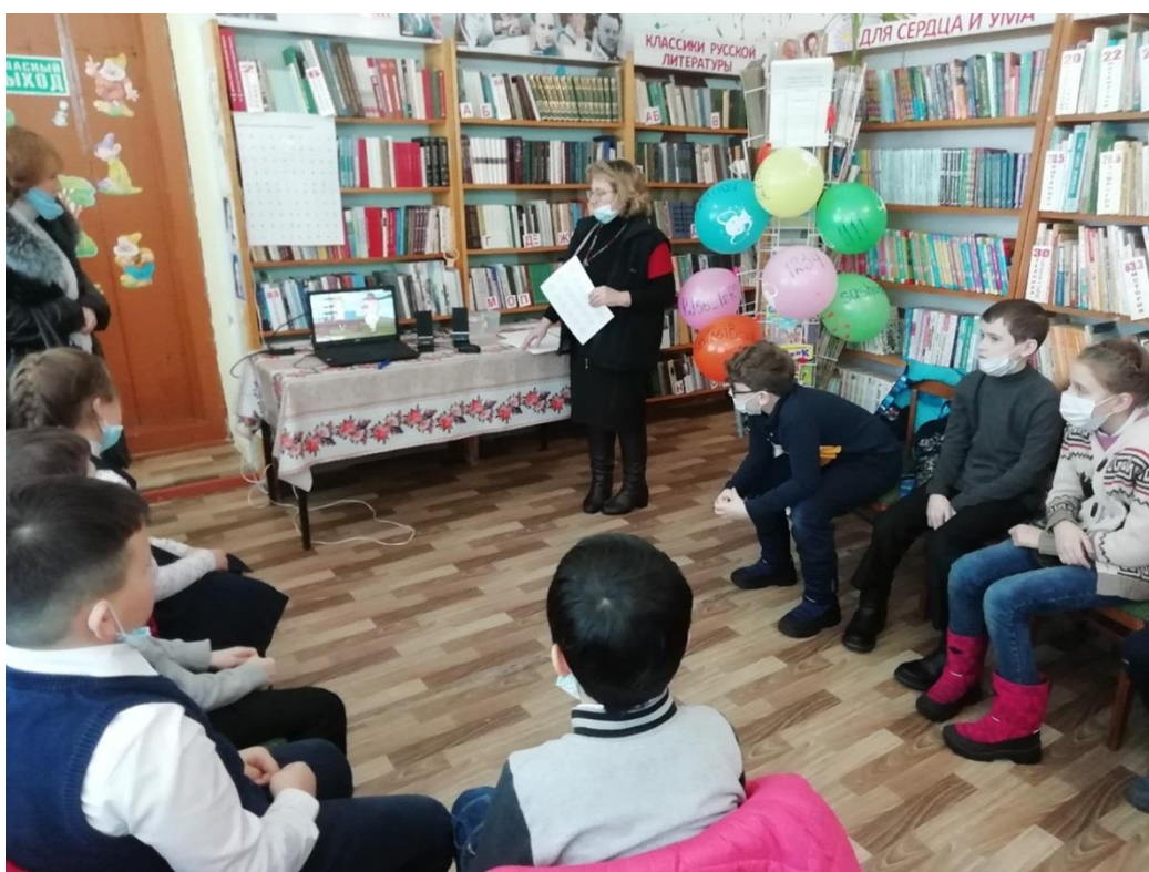
Кипеловский библиотечный филиал № 8 МБУК «Межпоселенческая централизованная библиотечная система Вологодского муниципального района»