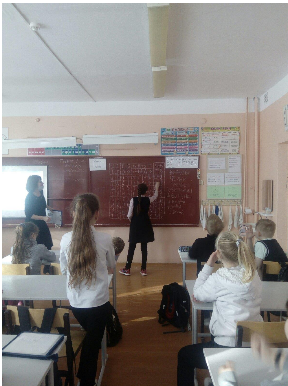
Фофанцевский библиотечный филиал № 41 МБУК «Межпоселенческая централизованная библиотечная система Вологодского муниципального района»