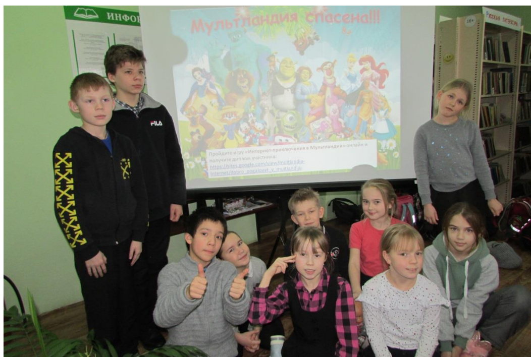
Несвойский библиотечный филиал № 42 МБУК «Межпоселенческая централизованная библиотечная система Вологодского муниципального района»