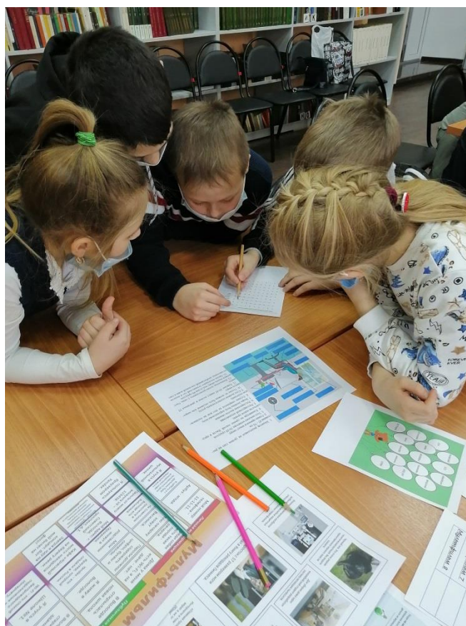
Вологодская районная детская библиотека-филиал МБУК «Межпоселенческая централизованная библиотечная система Вологодского муниципального района»