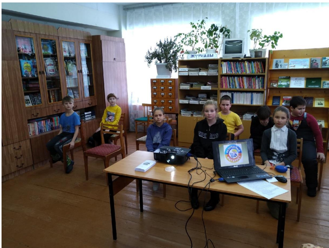
Куркинский библиотечный филиал № 44 МБУК «Межпоселенческая централизованная библиотечная система Вологодского муниципального района»