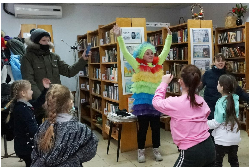
Грибковский библиотечный филиал № 26 МБУК «Межпоселенческая централизованная библиотечная система Вологодского муниципального района»