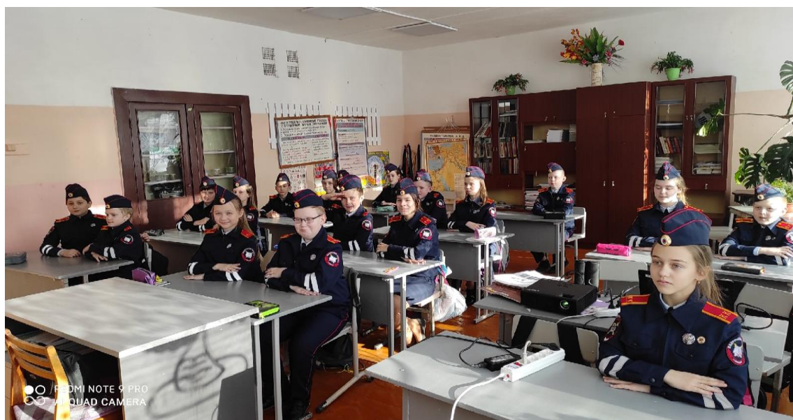
Семенковский библиотечный филиал № 1 МБУК «Межпоселенческая централизованная библиотечная система Вологодского муниципального района»