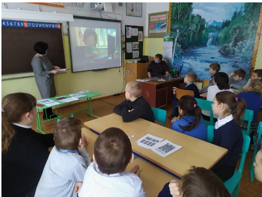
Порозовский библиотечный филиал № 38 МБУК «Межпоселенческая централизованная библиотечная система Вологодского муниципального района»