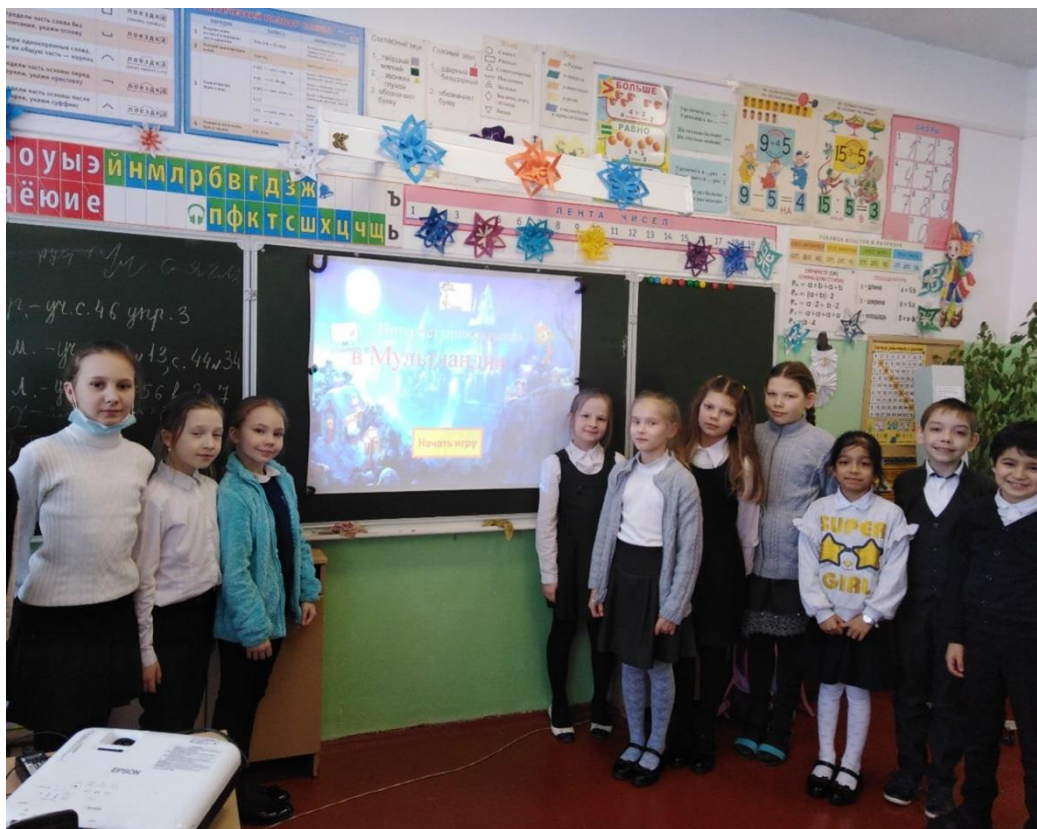
Ермаковский библиотечный филиал № 9 МБУК «Межпоселенческая централизованная библиотечная система Вологодского муниципального района»