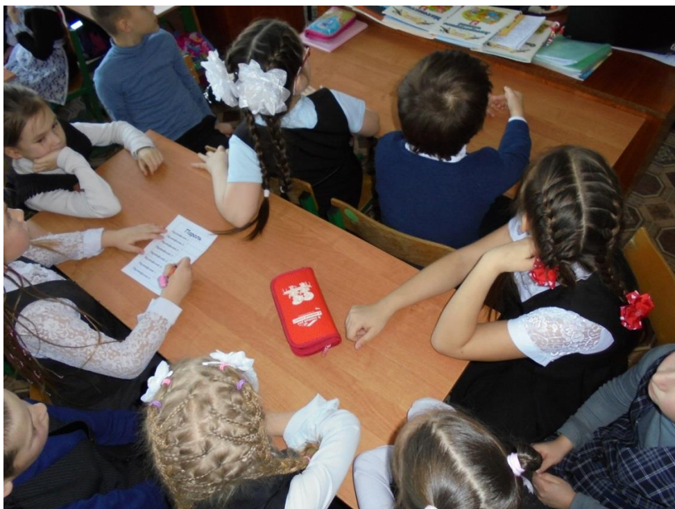
Враговский сельский филиал № 1 МБУК «Межпоселенческая централизованная библиотечная система Междуреченского муниципального района»