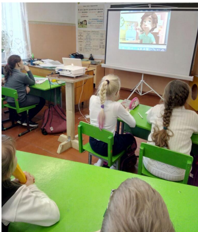
Детский филиал МБУК «Межпоселенческая централизованная библиотечная система Междуреченского муниципального района»

Библиотеки Междуреченского района участвуют в акции «День безопасного Интернета» ежегодно и отмечают, что школьники каждый раз узнают и открывают для себя что-то новое, уровень их знаний по теме интернет-безопасности 8 год от года растет.