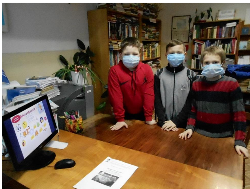
Шейбухтовский сельский филиал № 6 МБУК «Межпоселенческая централизованная библиотечная система Междуреченского муниципального района»